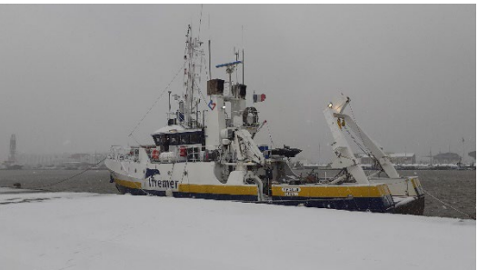
Saint-Nazaire - février 2021 – crue décennale